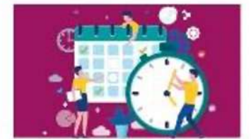
Calendario de actividades